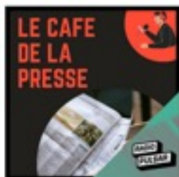
Le Café de la presse