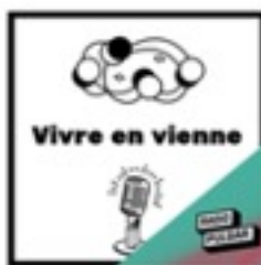
Vivre en Vienne