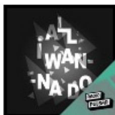
All I Wanna Do